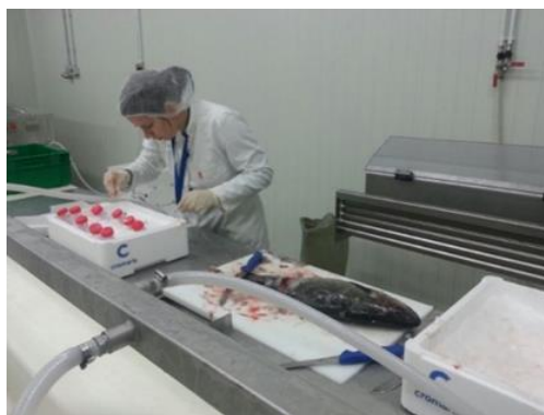
Slika 3. Uzorkovanje i pohranjivanje uzoraka

Riba je hranjena do sitosti 3 do 7 puta dnevno, ovisno o dobi i sezoni, hranom različitog kemijskog sastava (CF, SP=48,0, SM=16,0; EXF, SP=52,0, SM=21,0; NCF, SP=56,0; SM=18,0) (tablica 1). Pothlađena riba dopremljena je u pogon za sortiranje i prerađivanje ribe. Mjerena je ukupna duljina tijela TL (cm) pomoću ihtimetra i ukupna masa tijela W (g) svake jedinice na vagi. Iz svakog hranidbenog tretmana uzorkovano je tkivo u području podrepne peraje i pohranjeno u epruvete koje su se do laboratorijskog određivanja masnokiselinskog sastava i koncentracije malondialdehida čuvale na temperaturi od -80°C na Veterinarskom fakultetu u Zagrebu (slika 3).