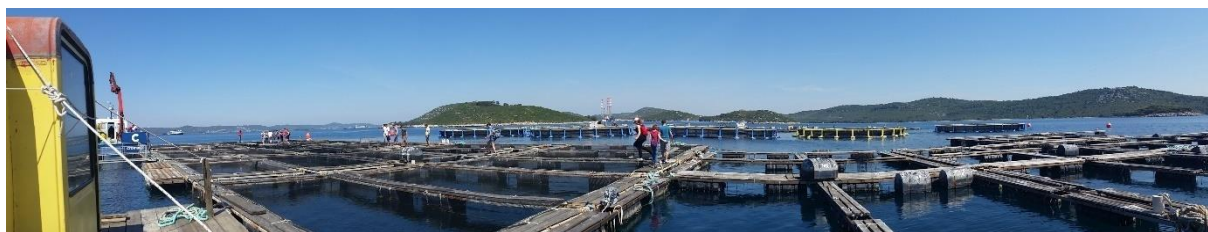
Slika 2. Lokacija istraživanja - uzgajalište Bisage

Pokus je proveden na uzgajalištu Bisage pod koncesijom tvrtke Cromaris d.d. (otočić Bisage, 44 0 01'28.6"N 15 0 13'11.2"E) u Zadarskom akvatoriju tj. u blizini uvale Mala Lamjana (slika 2). Izveden je u 6 akvakulturnih kaveza pojedinačnih dimenzija 9x5x5 m (V=225 m 3 ), odnosno 3 hranidbena tretmana: CF (komercijalne hrane za hamu), EXF (eksperimentalne hrane Cromaris) i NCF (komercijalne hrane za lista) s 2 ponavljanja, u trajanju od 17 mjeseci tj. u razdoblju od 5. srpnja 2016. - 27. studenog 2017. godine. Temperatura mora mjerena je svakodnevno na dubini od 2 m. Najveća izmjerena dubina uvale jest 37 m te se uvala kategorizirala plitkom.