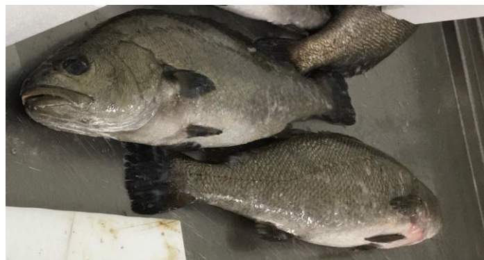
Slika 1. Hama ( Argyrosomus regius )

Hama (krb, grb, krap), Argyrosomus regius (Asso, 1801) jest riba koja pripada razredu koštunjača ( Osteichthyes ), podrazredu zrakoperki ( Actinopterygii ), nadredu pravih koštunjača ( Telostei ), skupini redova tvrdoperke ( Acanthopterygii ), redu grgečki ( Perciformes ), podredu pravih grgeča ( Percoidei ) i porodici sjenki ( Sciaenidae ). Prirodno obitava na istočnom dijelu Atlantika od Gibraltara do Konga, uključujući i Mediteransko i Crno more (Kružić i sur., 2016). Hama pripada veličinom najvećim sjenkama, može narasti do 2 metra duljine i mase od 70 kg. Tijelo joj je izduženo, bočno spljošteno, sivosrebrnaste boje s brončanim odsjajem te uskim i kosim prugama smeđe boje na leđima (Jardas, 1996). Priobalna je vrsta ribe koja preferira mutnije vode s pjeskovitim i stjenovitim dnom te se uglavnom zadržava na manjim dubinama iako može obitavati i na dubinama do 200 metara (slika 1). Karnivorna je vrsta, a u prirodi, mlađ se hrani malom demerzalnom ribom i rakovima, dok odrasle jedinke love pelagičnu ribu i glavonošce.